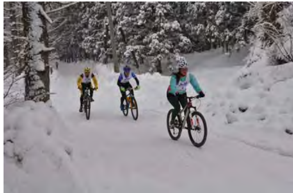
轍にはまり転倒する選手もいたが、けが人は出なかった。